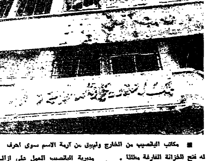
مكتب الليانصيب من الخارج ويظهر من أزمة الاسم سوى احرف

أما موايد السحب ، او نفس الجوائز فهي مبروطة بسرعة انجاز عمليات الترميم التي لم تبدأ بعد .